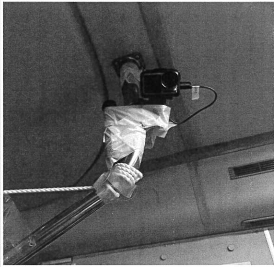
観測位置 I (入口)